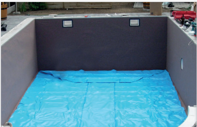
Montage der Schwimmbadfolie