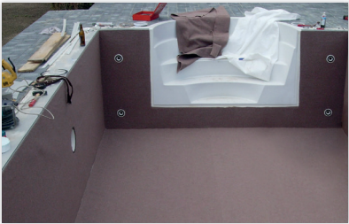
Vollflächige Verlegung des Spezialvlies