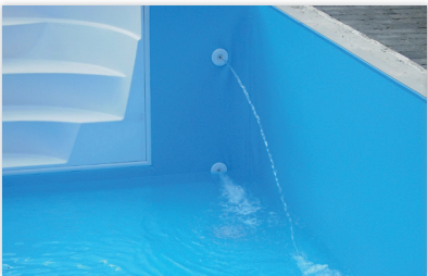
Befüllung des Beckens mit Wasser